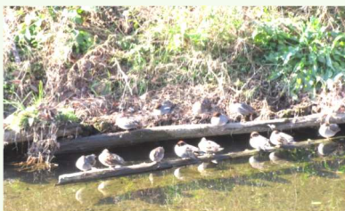
コガモ (2023.01.02 境川)

冬は葉っぱが落ち、渡り鳥も多くなるので、野鳥観察に絶好の季節。相模原市の北部を流れる境川周辺も多くの野鳥がきます。ジョウビタキ、シジュウカラ、モズ、アオジ、セキレイ、カワセミ、マガモ、コガモ、サギなどをよく見かけます。街中にも結構いるので、鳥の鳴き声がしたら、ちょっと立ち止まってみては。(え)