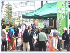
「相模原市民桜まつり」 ブース出展