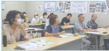
広報講座「いける！SNSで情報発信」