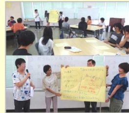
「ボランティアチャレンジスクール」 まとめの会 @相模ボラディア