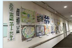
団体パネル展@ユニコムプラザさがみはら 団体パネル展@ソレイユさがみ