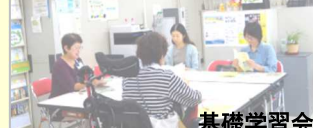
基礎学習会 「ボランティア・ビギナーズカフェ」