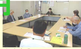
交流事業ほっとカフェ 「たまには寄り道市民活動」