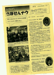
創刊号 (2003年2月10日発行)

私が初めて携わったのは、第32号(2011年6月発行)のレイアウト作業からでした。相模原のNPOを盛り上げたい、多くの人に知ってもらいたい、との想いを込めて編集しています。