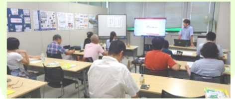
基盤強化講座「NPO資金調達学習会」