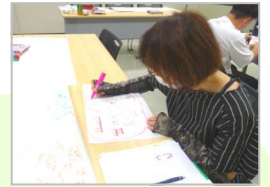
NPOステップアップ 「グラレコ挑戦！（見える話合い）」