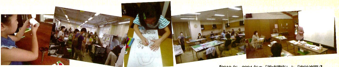
【2019年～2024年の「養成講座」と「実地演習」】

私たちは、今の子どもたちはものづくりの体験がとても少なくなっている状況を憂慮し、教育機関、企業、学術団体、自治体などと連携し、子どもたちに楽しくものづくりを教えられる大人向け養成講座を2020年より毎年開催してきました。これまで本講座を修了した方たちは、子どもセンター、幼稚園、小学校などで「ものづくり教育インストラクター」として活躍しています。この度、地域や家庭にものづくり文化を広めていく活動やものづくりのボランティア活動に興味・関心のある大人の方を対象に「ものづくり教育インストラクター養成講座」の募集を開始します。本養成講座では、ものづくり文化活動やボランティア活動に求められる教材開発力や企画力や指導力がつけられるように多彩な講師をそろえ、行います。ものづくりの意義や安全な道具の使い方、教材開発やオンラインの方法、紙や金属を使った工作遊び、指導展開の方法などを学びます。是非ご応募下さい。