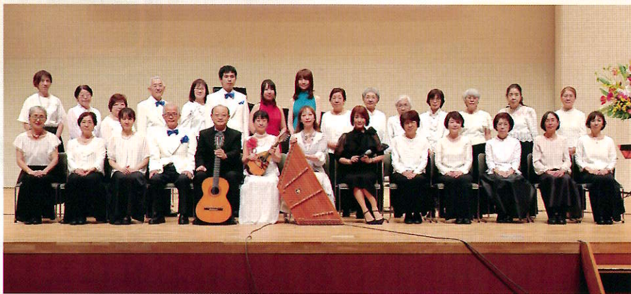
ピュアサウンズ定期演奏会に於て

2023年5月14日(日)に相模女子大学グリーンホール多目的ホールに於て、ピュアサウンズ20周年の式典と演奏、スクリーンを使って当団体を紹介する『ピュアサウンズ物語』の上演を行なった。