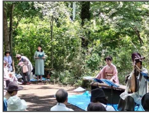
ここもの会・コンサートの様子

特に司会では過去の活動経験を活かし、団体のイベント等の司会を行っていただいています。先日も「木もれびの森の花と木々を守る会(ここもの会)」のコンサートにMCとして協力いただき、団体から感謝の言葉をいただきました。