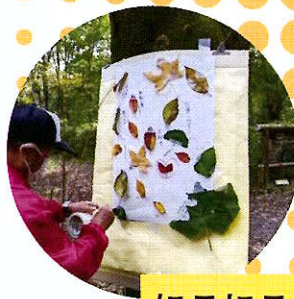
にこにこサロン支援