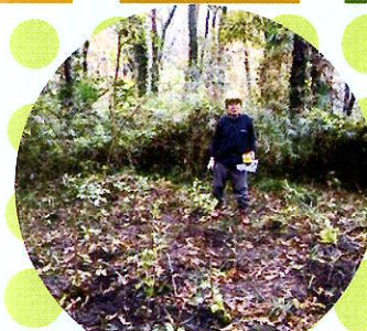
ドングリ苗木場づくり