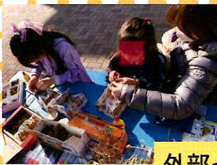
外部イベントへの参加