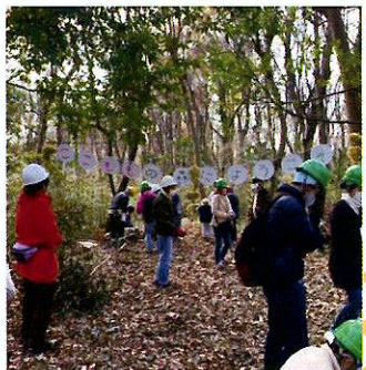
ミズキ広場で紙バック・ブンブンごまづくり