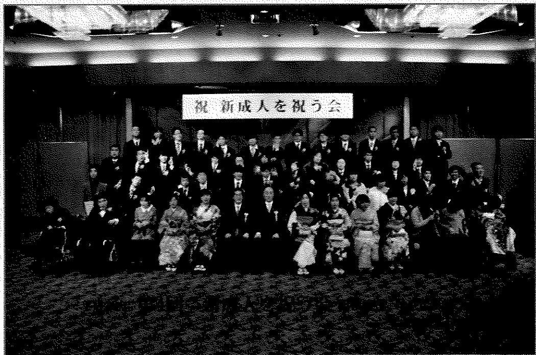
第四回新成人を祝う会の様子・平成30年1月27日開催