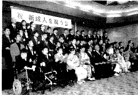
思い思いのポーズで記念撮影に臨む新成人たち 相模原市けやき会館

相模原 障害のある相模原市けやき会館（同市中人たちの「新中央区」で開かれた。人生の成人を祝う会）が27日、相模原市けやき会館で、