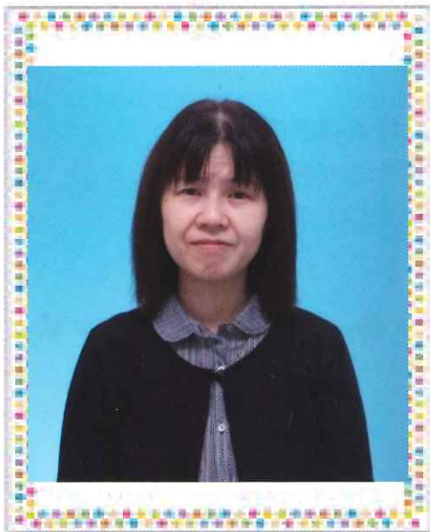
にっ と ゆかり