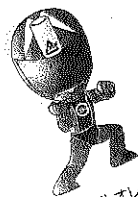
カンメタルオレンジ