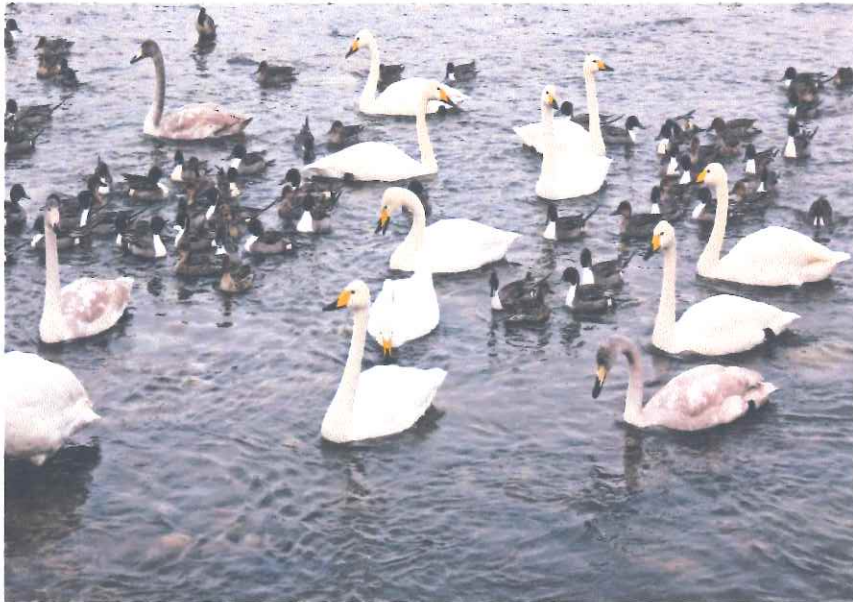
某新聞に白鳥が越冬して日本の沼でくつろいでいる様子が載っていました。

「手作り趣味とうたのサークル」 H30年2月～ 心肺機能の向上と転倒&認知症予防を目的としております。 参加をお待ちしています。