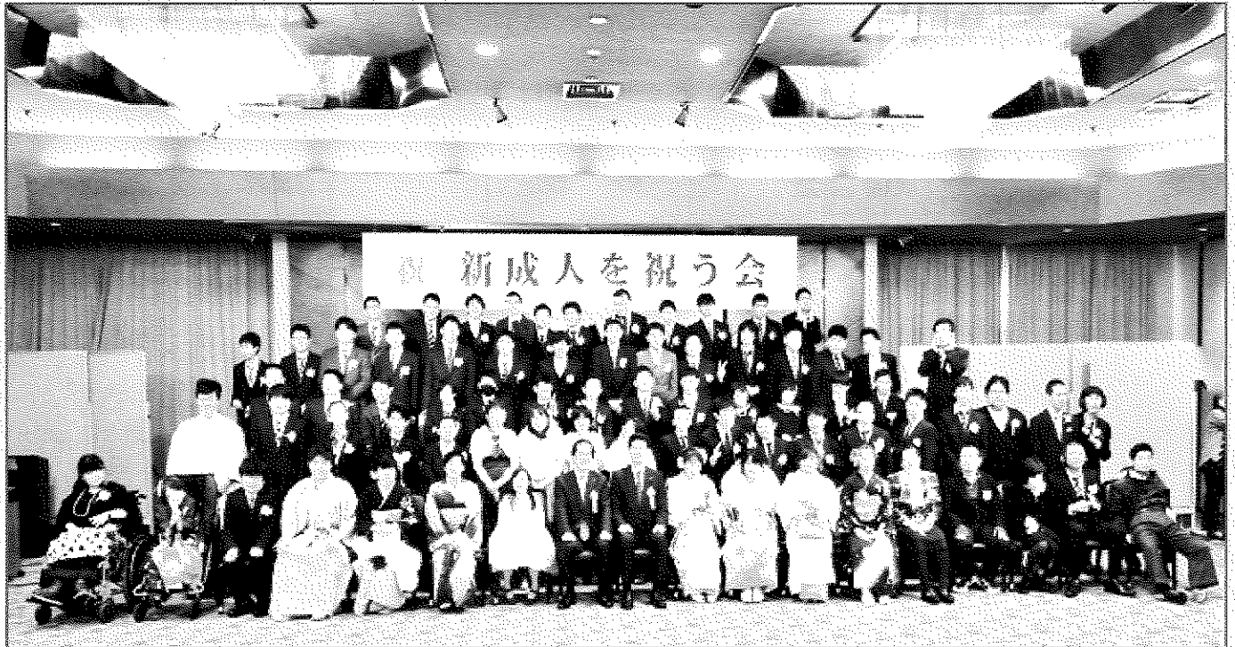
第三回新成人を祝う会の様子・平成29年1月28日開催