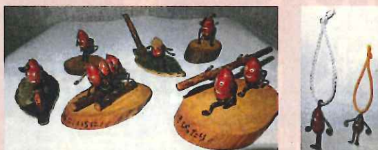
(NPO法人相模原こもれび 販売品)