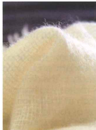
華やかなストール 高澤 史納

杉の清らかな香りと素朴な美しさを日常に、丸型や小判型、角型のお弁当箱でお昼が楽しみに。