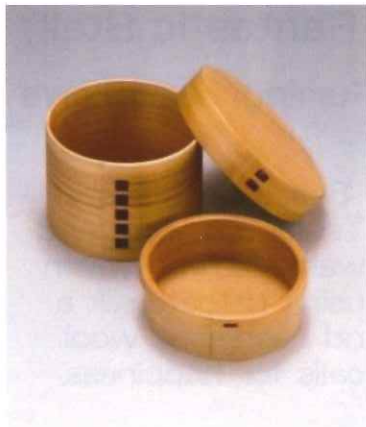
曲げわっぱ 栗盛 俊二

様々な素材や技法を駆使して独特の世界観を漆という日本古来からの伝統工芸技術により生み出した斬新なデザイン世界をお楽しみください。