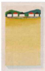
瀬尾夏美 《二重のまち》より 2015