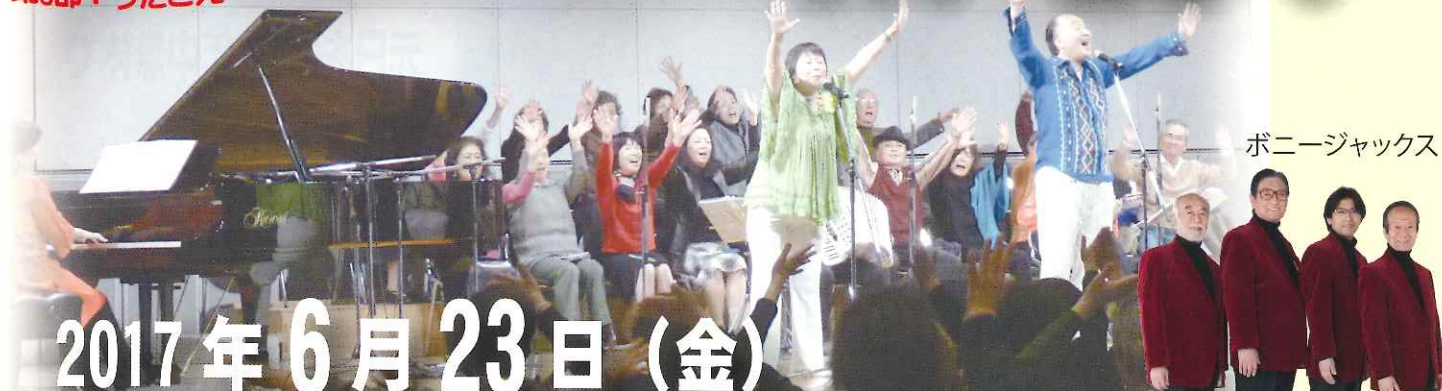
ポニージャックス

第1部：うたごえ 第2部：ポニーさんとブー スPECIALステージ 第3部：うたごえ